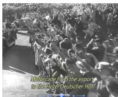
Кадр 11 (06:30)