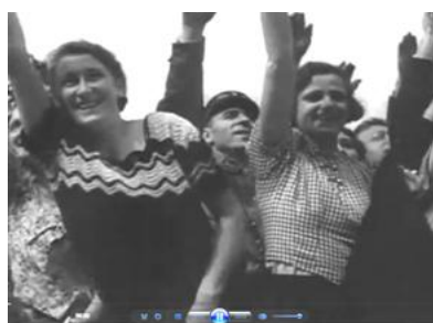
Кадр 9 (06:20)