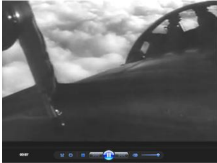
Кадр 1 (03:07)