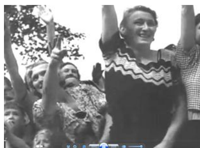
Кадр 10 (06:24)