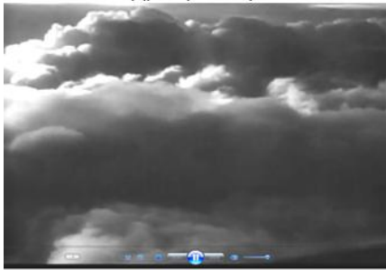
Кадр 2 (03:34)