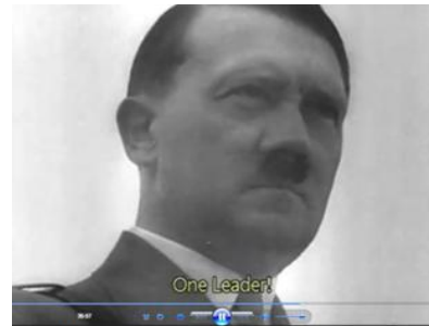
Кадр 5 (35:57) Ein Führer