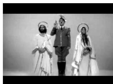
Кадр 12 (48:12)