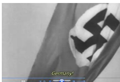
Кадр 7 (36:02) Deutschland