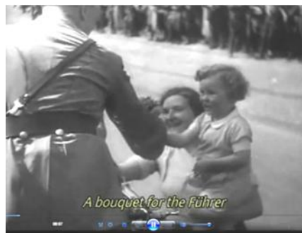
Кадр 3 (08:07)