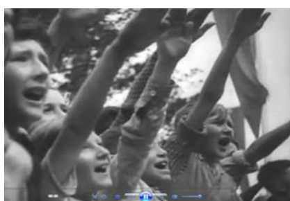
Кадр 8 (05:50)